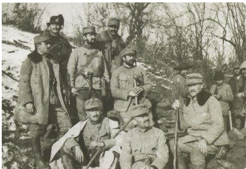
Tisztek és altisztek egy csoportja a Kárpátokban