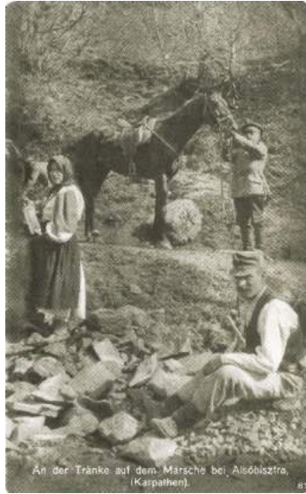
An der Tränke auf dem Marsche bei Alsóbisztrán, (Karpathen).

Lőitatós vonulás közben Alsóbisztrán, a Kárpátokban