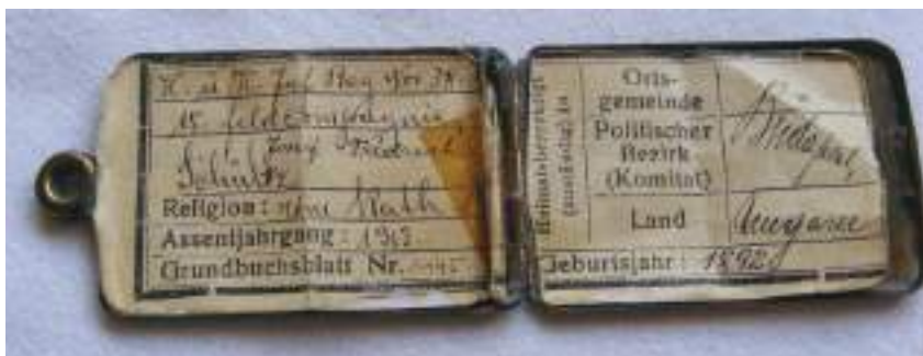
I. világháborús dögcédula - K.U.K. 38. Gyalogezred. A Kecskeméti Cs. és Kir. 38. Gyalogezred hős katonájának dögcédulája, aki a 15. században szolgált. A dögcédula saját réz tokjában van.