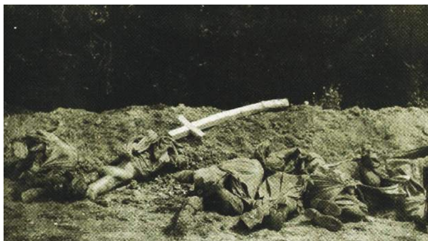
A harctéri jövődö tömegsírok „lakói”