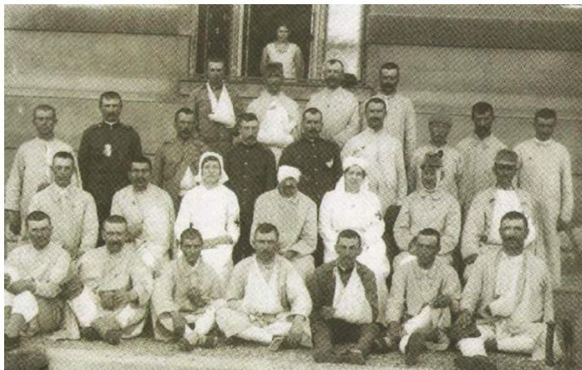
Sebesült honvédek a tábori kórház udvarán