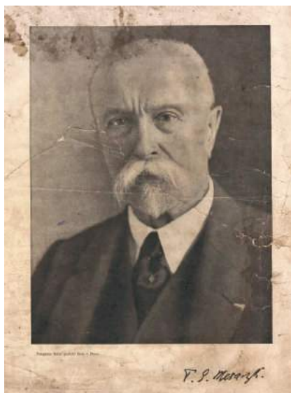
Tomáš Garrigue Masaryk (1850. 03. 07.–1937. 09. 14.)