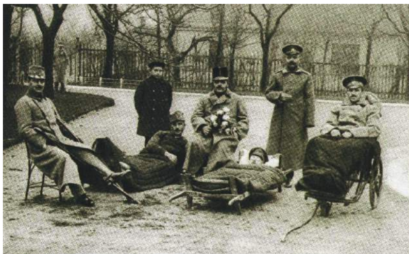
Német, orosz és magyar sebesültek együtt