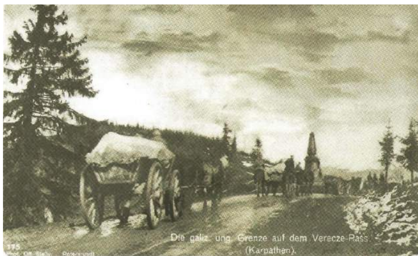
Vonuló hadtáp a galíciai-magyar határon a Vereckei-szorosban