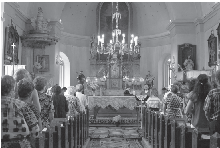
4. ábra: Vasárnapi mise a gyertyánligeti római katolikus templomban