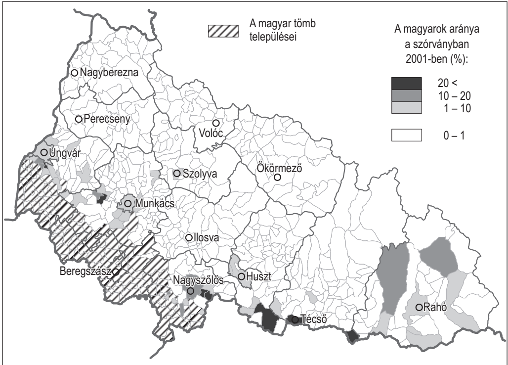
1. ábra: A magyar nemzetiségűek aránya a magyar tömbön kívüli településeken 2001-ben

Napjainkig a kárpátaljai szórvány számszerűsítésére is csak kevés kísérlet történt. Molnár József a szórvány kvantitatív határának a 20%-os küszöböt tartja. 20 Továbbá számszerűsíti a „nyelvsziget” tartalmát is: eszerint a magyar tömbön kívüli, 20–50%-ban magyarlakta települések sorolhatók ide. 21 A nyelvsziget terminus lényegében az összes, a kárpátaljai magyar településterületet bemutató munkában megjelenik, részben a szórvány részeként, 22 részben pedig a szórvánnyal egyenrangú fogalomként. 23 Ugyanakkor – Molnár idézett cikkét leszámítva – a tartalma némileg homályban marad, csak sejthető, hogy a magyarok magasabb aránya, esetleg az őshonosság (pl. koronavárosok), a településen belüli kompakt elhelyezkedés is szerepet játszik a nyelvszigetként való értelmezéskor. A nyelvszigetek