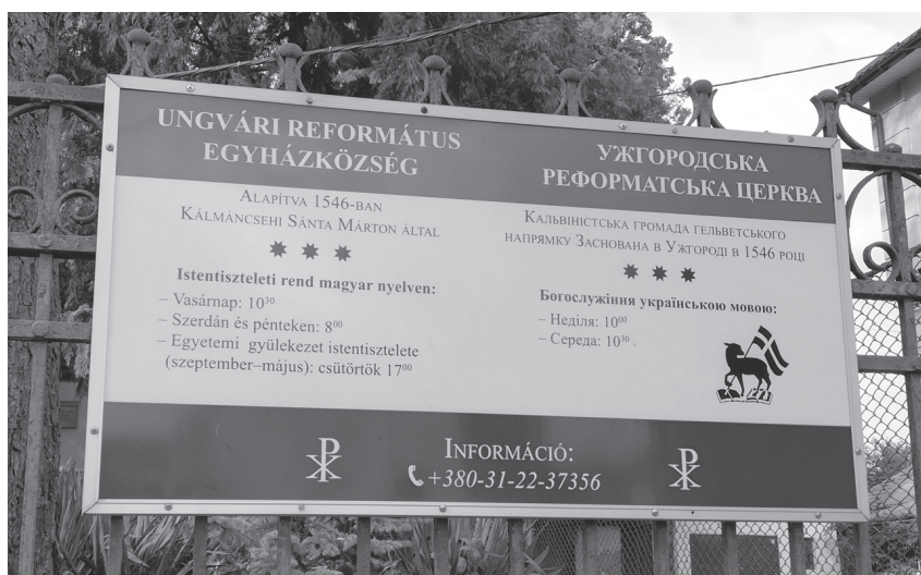
2. ábra: A református egyház istentiszteleti rendje Ungváron 2018 szeptemberében

A kárpátaljai rurális és urbánus szórványok egyik legfontosabb különbsége az intézményesültség – szoros összefüggésben az intézményeket eltartani képes magyar lakosság számával. Ennek egyik tipikus megjelenési területe az oktatás. Amíg Kárpátalján néhány évvel korábban a magyar tannyelvű intézmények küzdöttek a fennmaradásért, hogy elégséges számú gyermeket tudjanak beiskoláztatni, 37 addig az elmúlt években már inkább túljelentkezés van a magyar tanítási nyelvű óvodai csoportok és iskolai osztályok többségében. Ezt elsősorban a magyar intézmények jobb infrastrukturális helyzete, valamint a magyar nyelv iránti keresletnek a vegyes és ukrán családokban való megnövekedése magyarázza. Azonban Ungváron, ahol a magyar oktatás teljes spektruma elérhető, erre több magyar család is úgy reagált, hogy bár számukra fontos, hogy a gyermek (meg)tanuljon magyarul, de ezt a magyar óvodai/iskolai csoportokban nem látják biztosítva, hiszen azokban az ukrán nyelv dominál. Éppen ezért a szülők egy része praktikus okokból (intézmény közelsége), vagy a minőséget előtérbe helyezve (szakmailag felkészültebb, kedvesebb óvó néni/tanár néni, jobb híru/specializált iskola) inkább ukrán óvodába/iskolába adja a gyereket. A nem magyar anyanyelvű gyermekek és szüleik megjelenése a magyar iskolában azt is jelenti, hogy a gyakorlatban a folyosó nyelve sok esetben az ukrán, és a szülői értekezleteken is van, hogy átváltak ukránra.