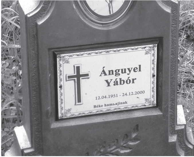
5. ábra: Sírfelirat Nagybocksón