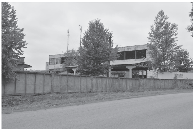
3. ábra: Romos gyárépület Nagybocksón

Az 1980-as években mindkét településen elindult a gyárak lassú, de biztos leépülése. Az üzemek, amelyek évtizedekig biztos jövőt és kiszámítható életpályáját jelentettek, az 1990-es évek elején bezártak. Az elhagyott, kifosztott gyárépületek napjainkig meghatározó elemei a településképeknek (3. ábra). Habár Nagybocksón ma is működnek kis méretű ipari foglalkoztatók, mind Nagybocksó, mind Gyertyánliget mély, posztindusztriális válsággal jellemezhető település társadalmi és gazdasági értelemben egyaránt.